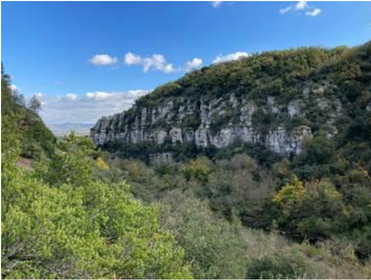
Gorges de la Payre

Le Hibou Grand-Duc est le plus grand rapace nocturne du monde. Avec son regard perçant et son envergure impressionnante, il se déplace la nuit et peut être entendu jusqu'à 1 kilomètre à la ronde de son « Ouuh » grave et étouffé. C'est un oiseau sédentaire, c'est-à-dire qu'il ne s'éloigne que rarement de son secteur. Il vit essentiellement près de falaises et d'escarpements rocheux, où il construit son nid et élève ses petits de décembre à juillet. La femelle ne pond qu'1 à 4 œufs, ce qui est relativement peu comparativement à d'autres oiseaux.